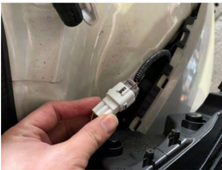
④カプラーを抜き、テールランプを取り外します。