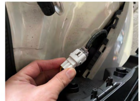
⑥カプラーを取り付け、逆の手順でテールランプを固定。