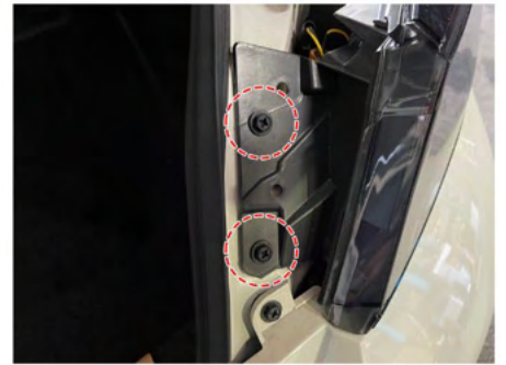
③カバー内にあるボルトを2本取り外します。