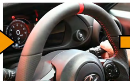
②規定数ライトスイッチをON-OFFする