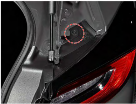
①テールランプ上部のボルトを取り外します。