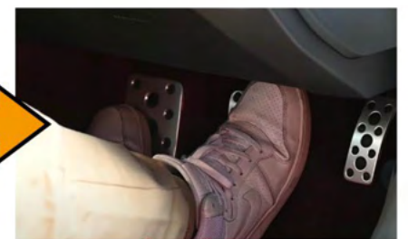
③ブレーキを5秒以上保持して足を離す