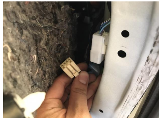
4.裏側にあるテールランプハーネスのソケットを取り外します。