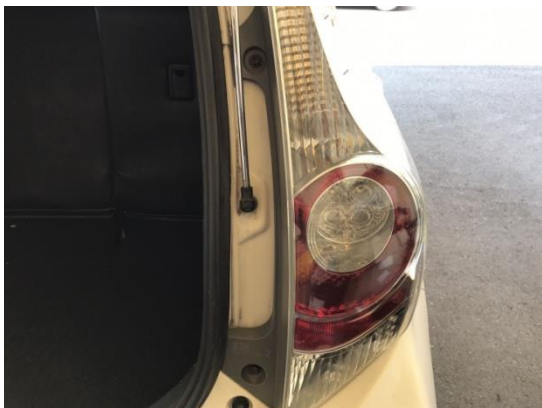
5.テールランプ側面のボルト 2 か所を取り外します。