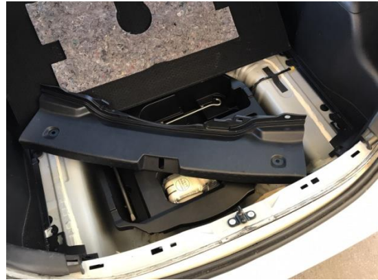
2.クリップを外し、デッキトリムカバーを取り外します。