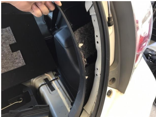
3.ビスを取り外し、デッキサイドカバーを浮かします。