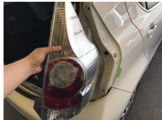
6.テールランプ本体を引き抜きます。※1