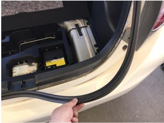
1.ウェザーストリップを取り外します。