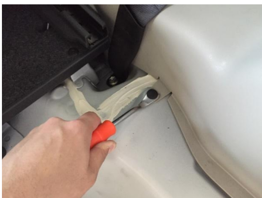
3. クォータートリムのクリップを取り外します。