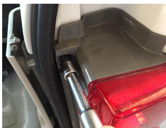
6. テールランプ内側にある上下2か所のボルト(10mm)を取り外します。