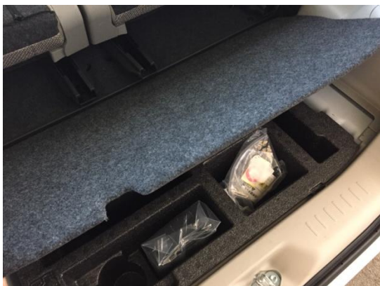
1. トランク内のボードを取り外します。