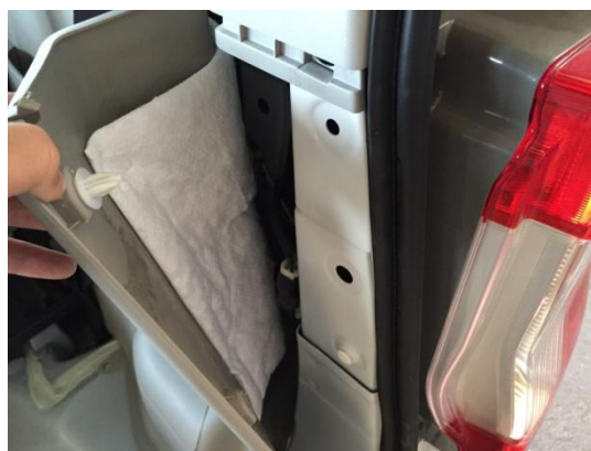
4. トリムを手前から浮かしていきます。