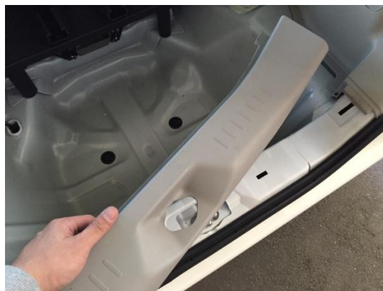
2. デッキとリムカバーを取り外します。