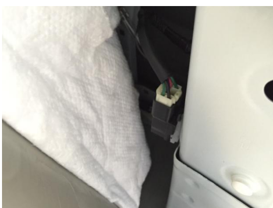
5. 隙間から見えるテールランプのコネクターを取り外します。